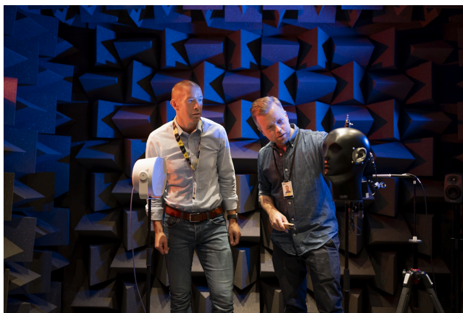
Mesures acoustiques dans les laboratoires de R&D d'Axis

En combinant des outils de pointe de l'industrie avec nos propres méthodologies sur mesure, nous sommes en mesure d'optimiser les performances et de stimuler l'innovation.