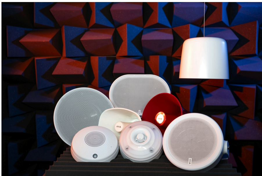
Les haut-parleurs Axis dans nos laboratoires de R&D.

Une fois la conception validée et reproductible en place, nous tirons parti du traitement numérique du signal pour libérer tout le potentiel de notre création.