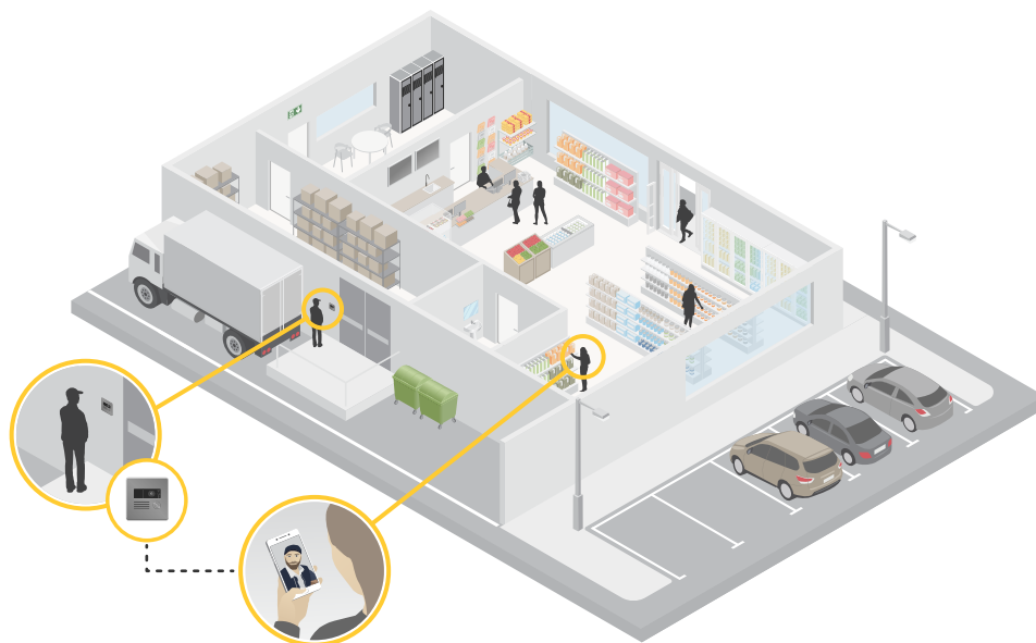
Figure 2. Uma implantação de segurança típica para uma empresa de pequeno ou médio porte. O intercomunicador com vídeo permite que os funcionários recebam mercadorias e destranquem portas para visitantes sem deixar os clientes desacompanhados.

O comum seria normalmente haver um típico sistema pequeno, com um punhado de câmeras em rede e um único intercomunicador, em uma pequena loja de varejo ou escritório. Esse tipo de equipamento cobre as necessidades básicas de monitoramento e comunicação. Essa solução permite, por exemplo, que os funcionários de uma loja se comuniquem com o motorista de um caminhão e abram a porta na área de carga para receber mercadorias sem ter que deixar o caixa e os clientes desacompanhados na loja.