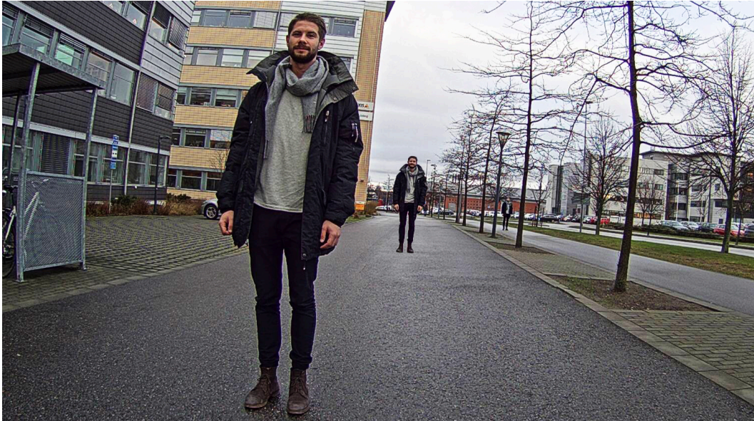
Abbildung 2.1 Eine Kombination aus drei Fotos der gleichen Person zur Veranschaulichung von drei Kriterien der technischen Anforderungen. Die Person, die der Kamera am nächsten steht, ist nah genug, um identifiziert werden zu können. Die Person in der Mitte ist erkennbar, bei der am weitesten entfernten Person kann nur ihre Anwesenheit festgestellt werden.