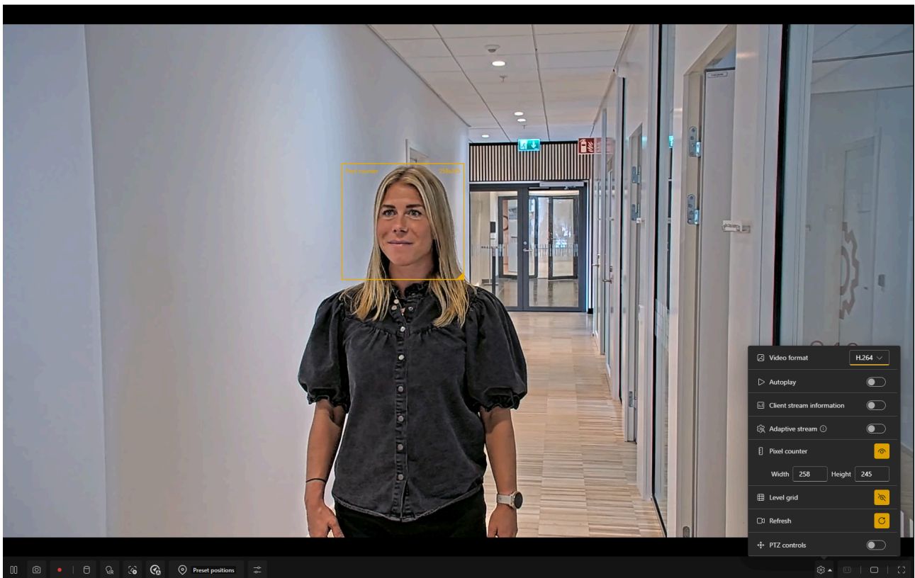
Figura 4.2 Imagen de una cámara con el contador de píxeles. La herramienta muestra que tenemos 258 píxeles en el marco, lo que significa que es posible realizar la validación (se necesitan como mínimo 80 píxeles en el conjunto del rostro).