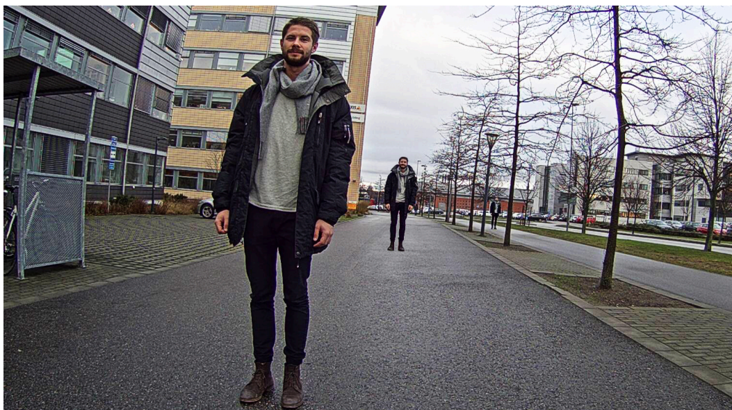
Figura 2.1 Uma combinação de três fotos do mesmo indivíduo para representar três dos critérios de requisitos operacionais. A pessoa mais próxima da câmera está perto o suficiente para ser identificada. A pessoa no meio pode ser reconhecida, enquanto a pessoa mais distante só pode ser detectada.