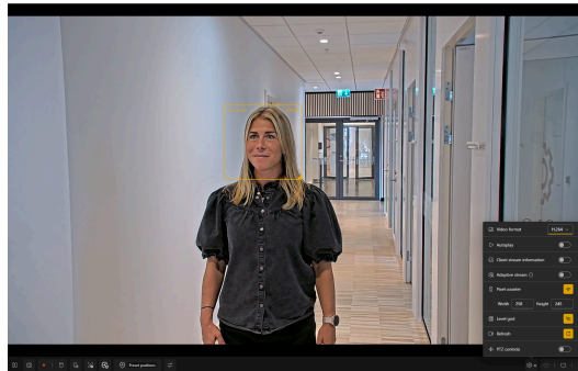
Figura 4.2 Imagen de una cámara con el contador de píxeles. La herramienta muestra que tenemos 258 píxeles en el marco, lo que significa que es posible realizar la validación (se necesitan como mínimo 80 píxeles en el conjunto del rostro).

forma de marco. Puede mostrarse en la visualización en directo con un contador para mostrar, en píxeles, la anchura y la altura del marco. Además, puede ajustarse y desplazarse por la imagen simplemente arrastrando y soltando.