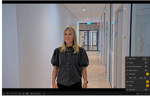
Ilustracja 4.2 Widok z kamery z widocznym licznikiem pikseli. Narzędzie pokazuje, że ramka ma szerokość 258 pikseli, co oznacza możliwość potwierdzenia (która wymaga minimum 80 pikseli przypadających na szerokość twarzy).