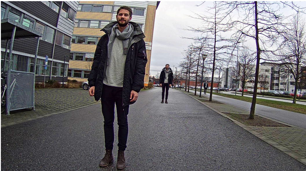
Figura 2.1 Uma combinação de três fotos do mesmo indivíduo para representar três dos critérios de requisitos operacionais. A pessoa mais próxima da câmera está próxima o suficiente para ser caracterizada. A pessoa no meio pode ser reconhecida, enquanto a pessoa mais distante só pode ser detectada.

Deve-se notar que as especificações desses requisitos operacionais são válidas em situações em que as imagens visuais do vídeo são interpretadas por operadores humanos. No caso de uso em análise de vídeo ou outros sistemas em que a análise da imagem é feita por software, os requisitos operacionais são outros, conforme aplicável. A imagem térmica, usando câmeras térmicas, também usa um conjunto diferente de especificações para requisitos operacionais.