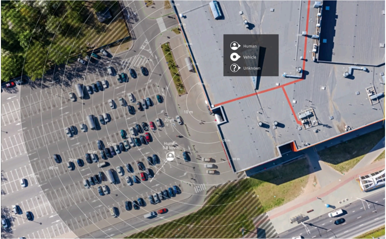
Figure 2. 包含场景参比图的安讯士雷达用户界面。

为了能够更加轻松地查看目标移动位置，您可以上载一份显示雷达覆盖区域的参考图（例如，一份平面图或航拍照片）。