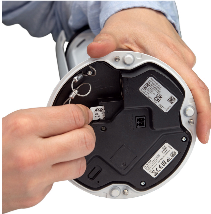
Figure 1. Axis 카메라의 감시 카드입니다.

Axis 감시 카드는 감시 카메라의 일반적인 메모리 쓰기 동작에 맞게 특별히 개발되고 내구성이 우수한 microSDXC™ 카드입니다. 일반 소비자용 SD 카드보다 훨씬 더 많이 쓰고 덮어쓸 수 있습니다. 따라서 감시 카드는 마모되지 않고 더 오랜 시간 동안 카메라에 남아 있을 수 있습니다. Axis 감시 카드는 5년 보증이 제공되지만, 256 GB 이상의 저장 용량을 가진 버전은 일반적으로 10년 이상 또는 일반적으로 카메라를 사용하는 기간 동안 수명이 지속되는 것으로 나타났습니다.