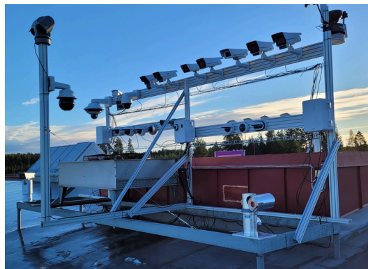
Figure 8. Cámaras de prueba Axis instaladas in situ en Skellefteå.