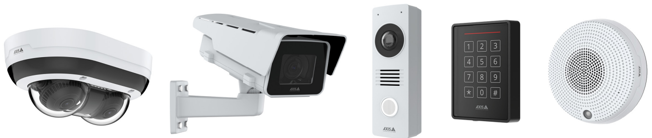
Figure 1. Varios tipos de productos Axis.

Este documento explica cómo Axis garantiza la calidad del hardware de sus productos por medio de una serie de meticulosas y exhaustivas pruebas.