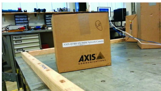
Figure 5. Equipo utilizado para la prueba de transporte.

altura de caída libre de 46 a 91 cm. Los ingenieros de embalaje de Axis diseñan buenos embalajes que ofrecen la resistencia suficiente como para proteger el producto frente a posibles daños.