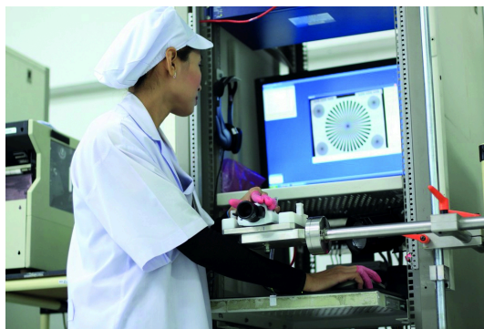
Figure 11. Una operadora con formación realiza algunas de las pruebas.

Los fabricantes que trabajan para Axis deben aplicar controles de calidad en todas las fases del proceso de producción. Este control incluye los componentes, las herramientas, la gestión, la selección y la formación del personal, y también los productos acabados, los embalajes de los productos, entre otras cosas. El producto acabado debe ajustarse a las especificaciones de diseño del producto en todos sus aspectos.