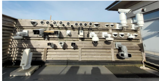
Figure 7. Cámaras de prueba Axis instaladas in situ en Lund.