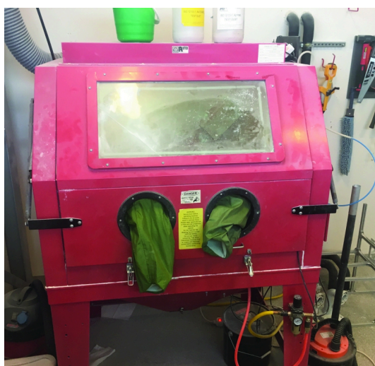
Figure 4. Cámara de polvo.