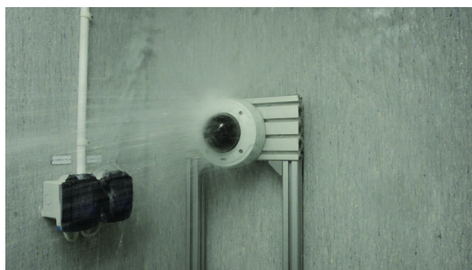
Figure 3. Prueba de estanqueidad de una cámara.

una atención especial a las juntas de estanqueidad. También se comprueba a fondo el funcionamiento del producto.