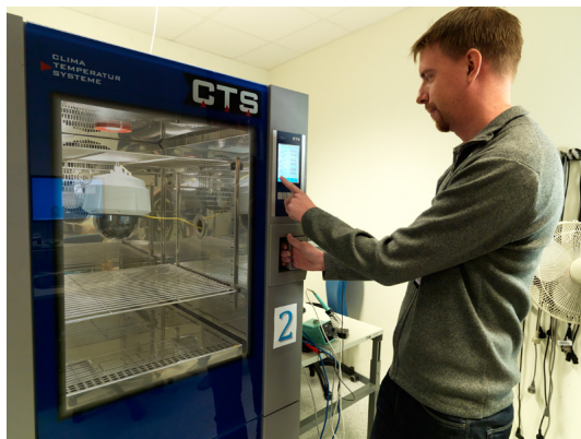
Figure 6. Prueba de temperatura en una cámara climática.

Las pruebas climáticas en laboratorio se realizan en cámaras climáticas, donde pueden simularse varios tipos de temperaturas y climas. Las pruebas se llevan a cabo con un margen de \pm 15 °C con respecto a los valores máximo y mínimo del rango de temperatura de funcionamiento. El rango de humedad va de 0 a 100 %.