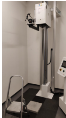
Figure 10. Comprobador de caída libre

Estas pruebas ayudan a evaluar cómo reacciona el producto a los cambios rápidos de temperatura cuando se traslada del exterior al interior, las caídas al suelo y otros golpes que podrían producirse durante el uso, la resistencia a la abrasión y al polvo cuando se lleva puesto, el rendimiento de la batería y su vida útil.