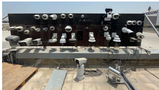
Figure 9. Cámaras de prueba Axis instaladas in situ en Dubái.