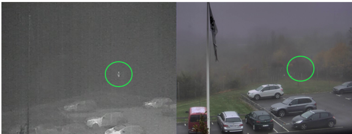
Bilder einer Wärmebildkamera (links) und einer visuellen Kamera (rechts) an einem nebligen Tag. Eine Person (in der Kreismarkierung) ist mit der Wärmebildkamera zu erkennen, nicht aber mit der visuellen Kamera.

Axis Wärmebildkameras arbeiten hauptsächlich im langwelligen Infrarotbereich (LWIR). LWIR-Wellenlängen werden unter Bedingungen mit Schwebstoffteilchen in der Luft wie Nebel und Rauch generell besser übertragen als die Wellenlängen von sichtbarem Licht. Die „kurzen“ Wellenlängen des sichtbaren Lichts werden in den meisten Fällen von den Partikeln stärker absorbiert und gestreut als die LWIR-Wellenlängen. Das verkürzt die Erfassungsreichweite visueller Kameras im Vergleich zu Wärmebildkameras. Eine Person, die bei Nebel mit einer Wärmebildkamera deutlich zu sehen ist, kann für eine visuelle Kamera unsichtbar sein.