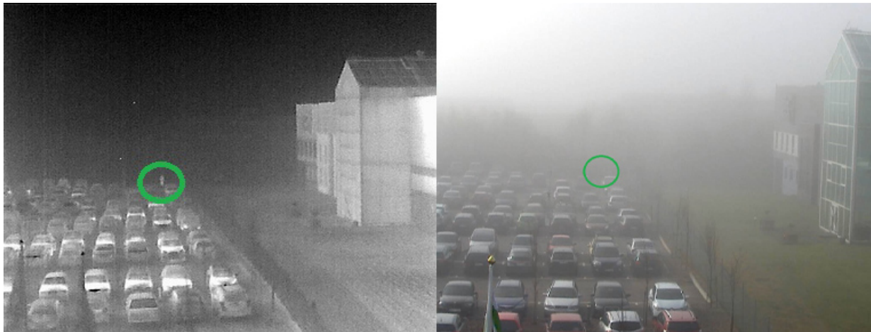
Bilder einer Wärmebildkamera (links) und einer visuellen Kamera (rechts) an einem nebligen Tag. Eine Person (Kreismarkierung) kann mit der Wärmebildkamera gesehen werden, nicht aber mit der visuellen Kamera.

einer visuellen und einer Wärmebildkamera. Die Erfassungsreichweite einer Wärmebildkamera wird in der Regel weniger durch das Wetter (z. B. Nebel) beeinträchtigt als bei einer visuellen Kamera.