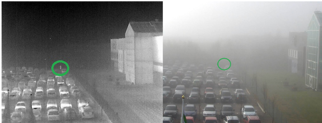
Imagem de uma câmera térmica (à esquerda) e uma câmera visual (à direita) em um dia nublado. Uma pessoa (circulada) pode ser distinguida com a câmera térmica, mas não com a câmera visual.

É essencial lembrar que os critérios de Johnson são válidos apenas em condições ideais. As condições climáticas no local afetarão a faixa de detecção do olho humano, de uma câmera visual e de uma câmera térmica. A faixa de detecção de uma câmera térmica é normalmente menos influenciada pelo clima, por exemplo, em um dia nublado, do que a faixa de uma câmera visual.