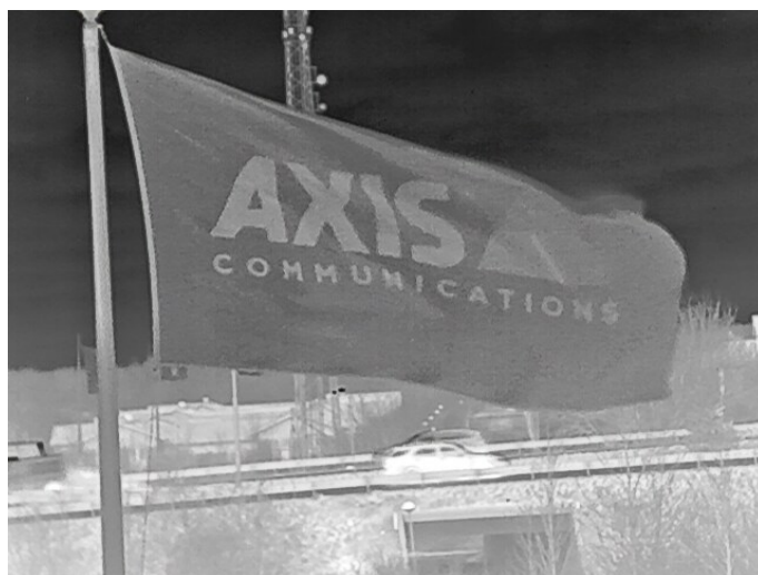
Bandeira atrapalhando a vista.

As câmeras térmicas com suporte para estabilização de imagem eletrônica são menos afetadas pela vibração. No entanto, estes fatores ainda devem ser considerados ao instalar uma câmera térmica para otimizar o desempenho da câmera.