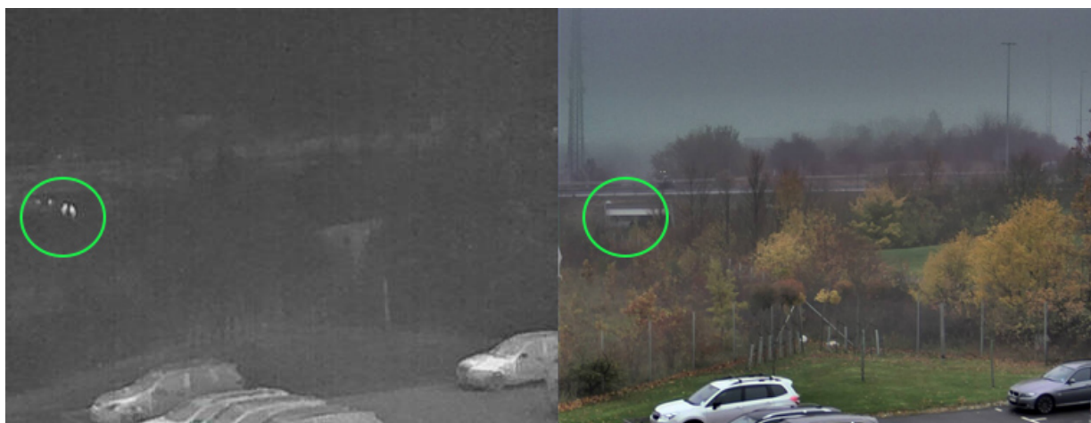
在雨天条件下，热成像摄像机拍摄的图像（左）和感光摄像机拍摄的图像（右）。使用热成像摄像机，能够轻松区分人物个体（已圈出供参考）。

虽然散射意味着到达摄像机传感器的能量减少，但被抹平的背景温度不会影响传感器。但由于它会降低图像对比度，因此背景中的细节将较难区分，而且图像看起来也将较不清晰。在这种情况下，热成像摄像机仍然比较容易侦测到人，因为有体温的人与低温背景之间的对比度将依然较大。