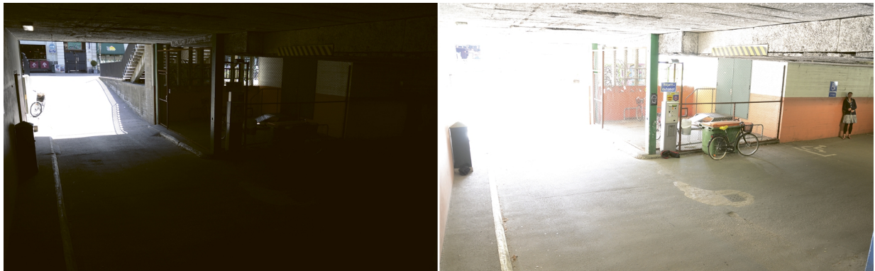
Figure 1. Scène de surveillance typique présentant une plage dynamique étendue, en l'occurrence l'intérieur d'un parking couvert et son entrée. Les deux images sont prises avec des temps d'exposition différents, plus court à gauche et plus long à droite.

Les images ci-dessous représentent une scène à plage dynamique étendue, capturée par une caméra de surveillance sans fonction WDR.