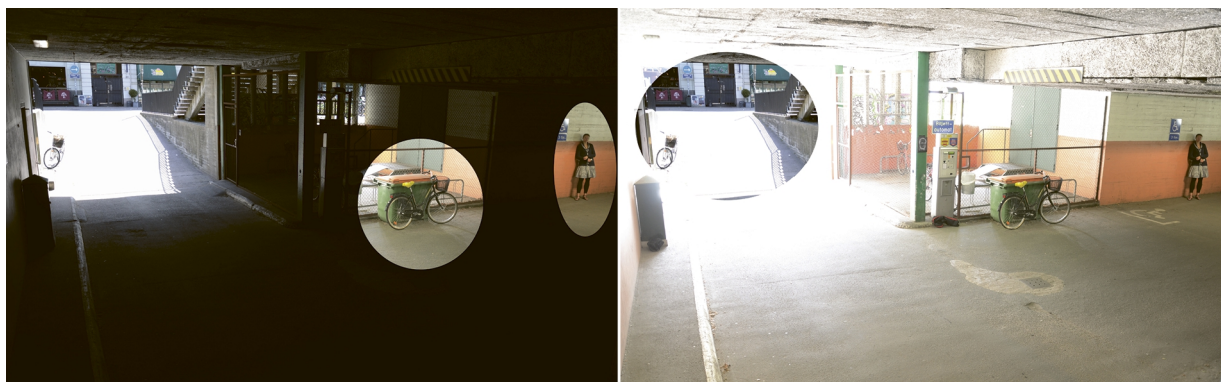
Figure 2. A mesma cena de antes. A imagem à esquerda mostra detalhes que foram perdidos com o tempo de exposição curto. A imagem à direita mostra os detalhes que foram perdidos com o tempo de exposição longo.

As imagens a seguir têm inserções da imagem de curta exposição na imagem de longa exposição e vice-versa. Fica evidente que objetos importantes na cena não foram detectados pela câmera sem WDR.