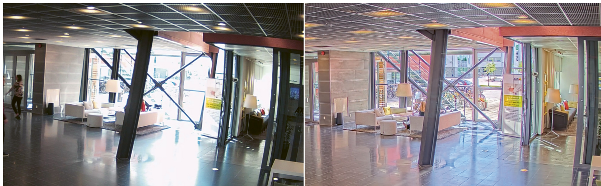
Figure 3. Cena em um ambiente interno com iluminação de fundo intensa. Comparação entre uma câmera sem o recurso WDR (esquerda) e uma câmera Axis com WDR Forense (direita).

A figura abaixo compara uma cena capturada com duas câmeras diferentes: uma câmera sem o recurso WDR, à esquerda, e uma câmera Axis com WDR Forense, à direita. Com o WDR Forense, os detalhes ficam mais claros e visíveis, tanto no interior iluminado quanto no exterior.